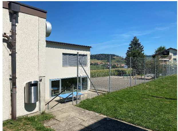
Werkraum im Untergeschoss mit Tageslicht