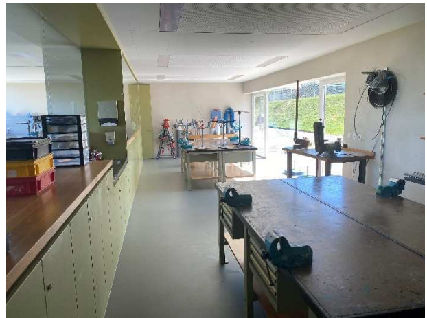
Werkraum im Untergeschoss mit Tageslicht