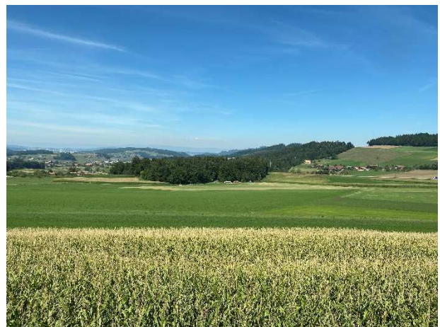
Aussicht Richtung Nordwesten