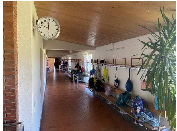
Korridor und Garderoben