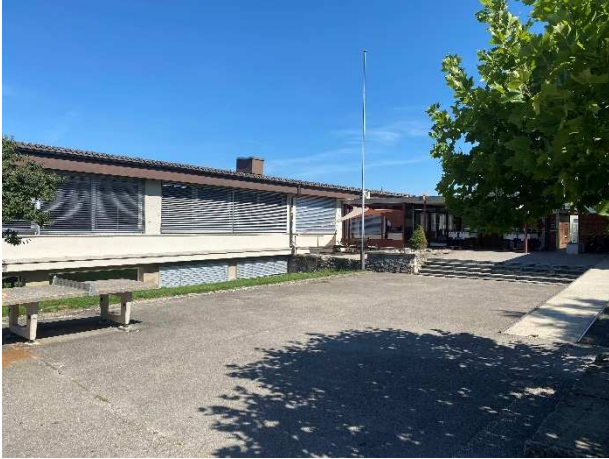
Schulhaus mit gedecktem Eingangsbereich