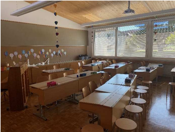
Klassenzimmer mit Parkettboden