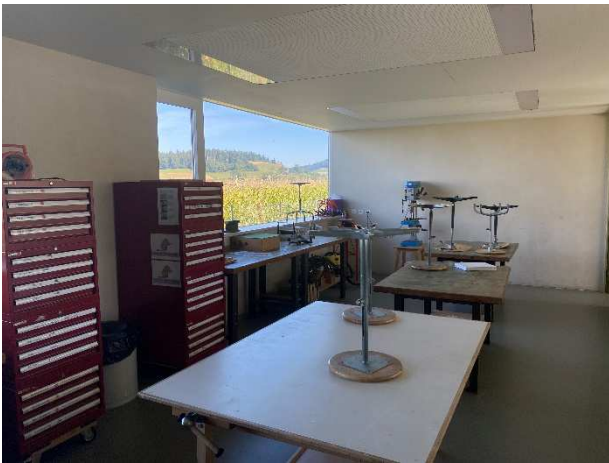
Werkraum mit Blick in die Landschaft