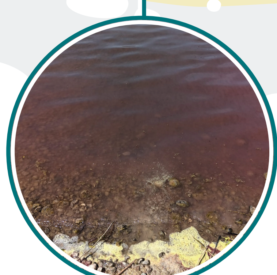
Planktothrix rubescens (Burgunderblutalge)