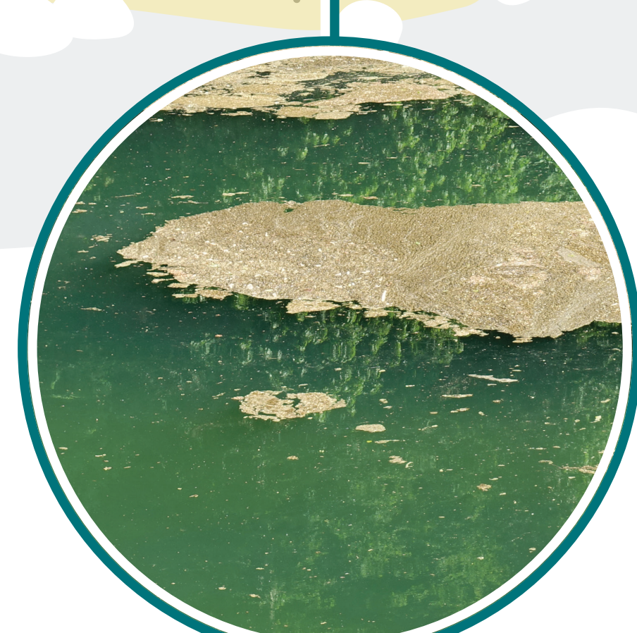
Oscillatoriales (Fädige Blaualgen)